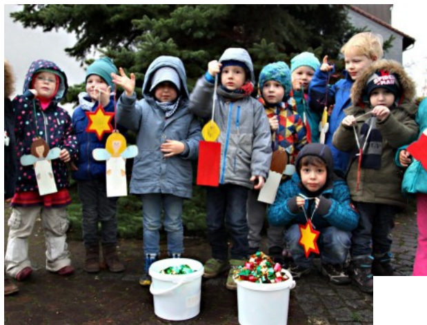
▼ fertig zum Aufhängen: Gelbe Holzsterne, rot-weiße Stiefel, bunte Engel und flammende Kerzen haben die Pänz des katholischen Kindergartens Heilig Kreuz für den Weihnachtsbaum gebastelt.

BEUEL. Der Bürgerverein Limperich bekommt große Hilfe von den Kindern des katholischen Kindergartens Heilig Kreuz. Die Kleinen helfen, den diesjährigen Weihnachtsbaum zu schmücken.